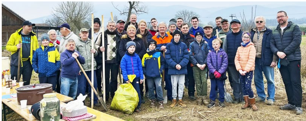
Spoločné sadenie v chatári

s topoľom, ktorý je typickou drevinou rastúcou na brehoch blízkeho Hornádu. No a v tieto dni k nej pribúdajú ďalšie. Dobrovoľníci aj miestni záhrad-