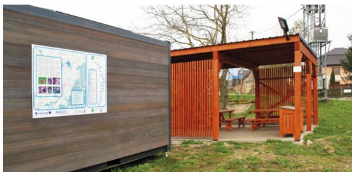
Kontajner - požičovňa kajakov s prístreškom v Ždani