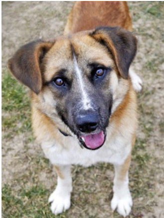
Filip, jeden zo zachránených. Na začiatku otvorené a hnisavé rany, teraz vďačný spoločník