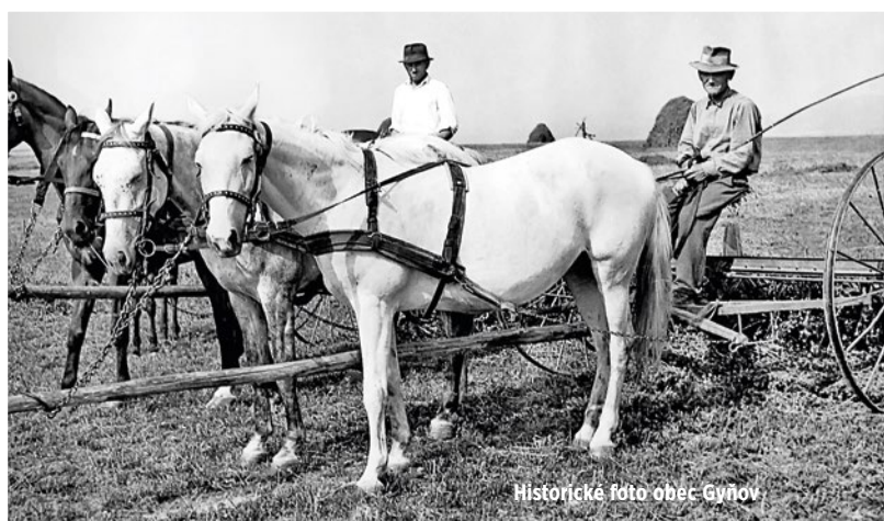
Historické foto obec Gyňov

Nová rubrika a jej prví nominanti vnútri čísla!