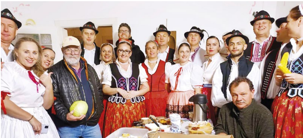
Haniščane s filmovým štábom pri kapuste