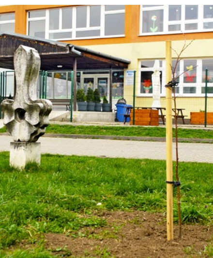
Mladá lipka pred základnou školou

Pred obecným úradom sa jej darí dobre (na snímke). Má veľa kamarátok – je totiž vyobrazená na pečati obce z roku 1786 a aj na erbe vedno