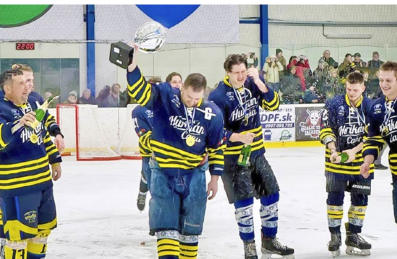
Radost víťazov z Čane

super podmienok počas celého turnaja, a aj rozhodcom, mali to s nami ťažké, ale aj my s nimi.“