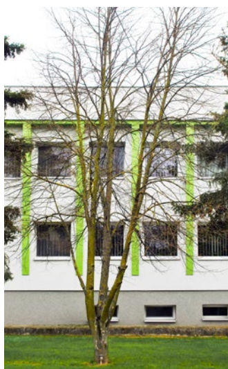
Lipa z roku 1999 má dnes 25

s topoľom, ktorý je typickou drevinou rastúcou na brehoch blízkeho Hornádu. No a v tieto dni k nej pribúdajú ďalšie. Dobrovoľníci aj miestni záhrad-