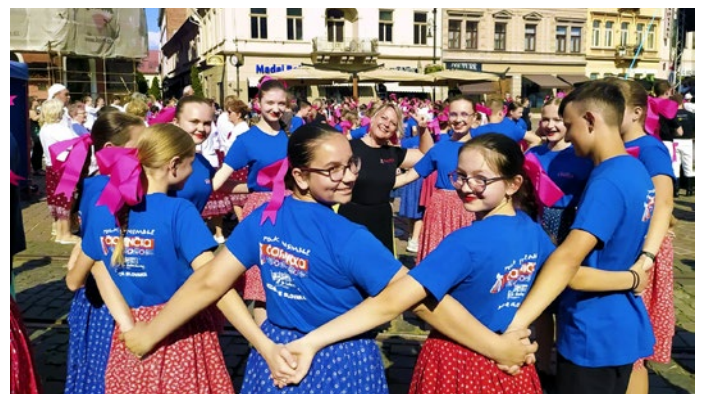
DFS Čarnička sa veselí na Radostnej Karičke Parchovianskej 2022