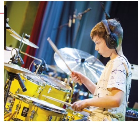
Pri hre na bicích je nutné chrániť si sluch

Je pol tretej. Súťaženie je skončené a nastáva očakávaná čerešnička na