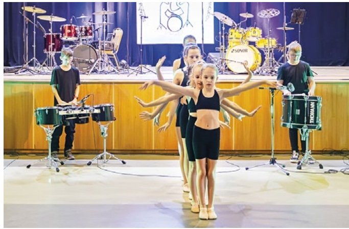
Vystúpenie bubenického súboru a žiačok tanečného odboru ZUŠ Valaliky

vedú, ako si nacvičili povinné skladby v hre na malý bubon, na sade bicích nástrojov, aj voľný repertoár s hudobným podkladom. Úroveň je