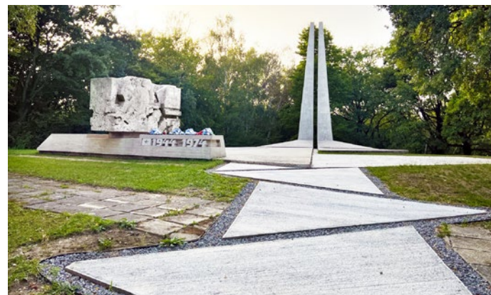
Pamätník v Skároši