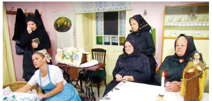
Paradne ňevesti v scénke Co bolo po pohrebe

„Túto tému som spočiatku odmietla. U nás plačky neboli a nevedela som, čo by sme ukázali. Neskôr sa mi to rozležalo v hlave. Urobila som výskum, navštívila starších ľudí v dedine, dala tomu príbeh a vyšlo to. Scénkou v tr-