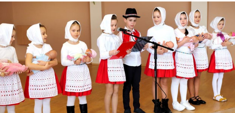
Školáci privítali malých kamarátov