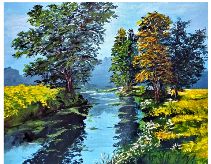
Zatiašie s riekou