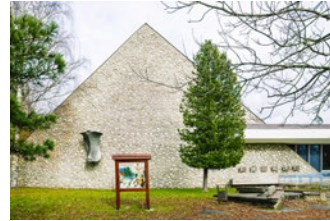
Múzeum TANAPU v Tatranskej Lomnici