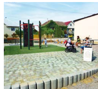
Oddychová zóna v Košickej Polianke.

Komplexne sme zrekonštruovali základnú školu, obnovili námestie pred kostolom, priestor pred školou a okolie obecného úradu. Intenzívne rozvíjame