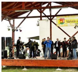
Sokolianske slávnosti v novom amfiteátri.

lili telocvičňu a šatne na futbalovom ihrisku.