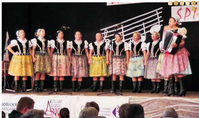
Naše najlepšie: ženská spevácka skupina Hutčanka z Vyšnej Hutky.