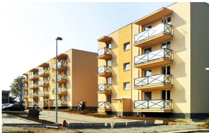
Nové bytovky postavili v Ždani.