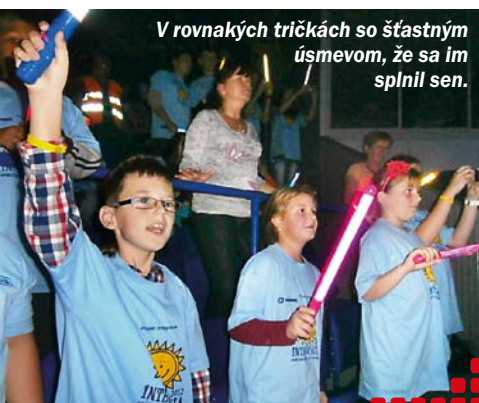
V rovnakých tričkách so šťastným úsmevom, že sa im splnil sen.