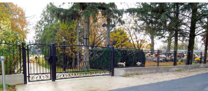
Nová kovaná brána na cintoríne v Belži.