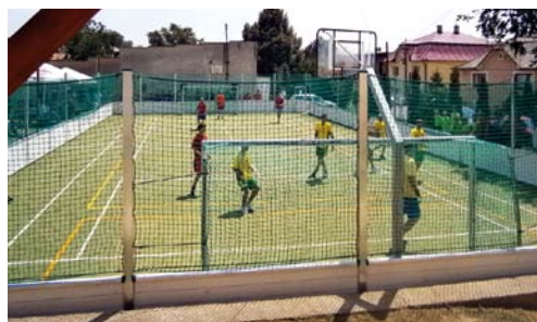
Hutčania sa tešia z nového multifunkčného ihriska.