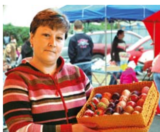
Kraslice jej zdobia dom po celý rok, nielen na Veľkú noc.

Veľká noc je ešte ďaleko, ale tie zdobené kraslice na jarmoku boli neprehliadnuteľné. Vyrobi-