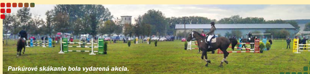
Parkúrové skákanie bola vydarená akcia.